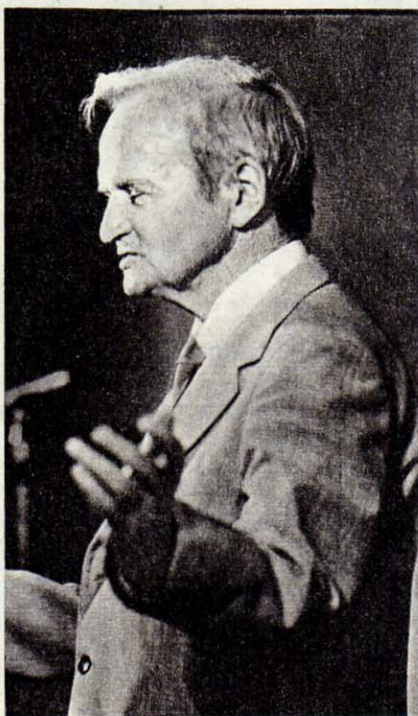
Первых обладателей Кубка Европы тренировал Гавриил Дмитриевич Качалин

По всей вероятности, чехословацкие футболисты не сумели поддержать темп, выбранный сборной СССР, и это подтвердил ход второго тайма. Иванов и Понедельник забили по мячу, и уверенность в победе не поколебал даже назначенный в ворота советской